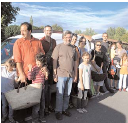
“La Semence” - Section clunisoise de l'Association pour le maintien d'une agriculture paysanne de proximité (AMAPP) de Vérosvres