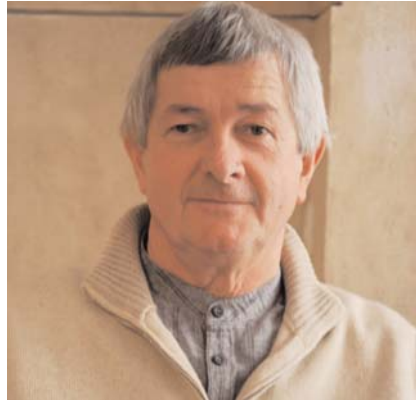
Agence immobilière AGI - Alain Guérin - 35, rue Mercière

La nouvelle Maison de santé du Clunisois vient d'ouvrir ses portes dans l'ancienne "Maison des Sœurs", rue de la Liberté. Sur ses trois niveaux, magnifiquement rénovés par l'Hôpital de Cluny, propriétaire des lieux, une vingtaine de professionnels de la santé, réunis en association, accueillent les habitants de Cluny et du Clunisois. Une nouvelle conception de la santé, soutenue par l'Europe, l'Etat et les collectivités locales, qui, alliant prévention et soins, permet à notre territoire d'être attractif pour les praticiens... et pour les patients ! La maison de santé est accessible aux personnes à mobilité réduite.