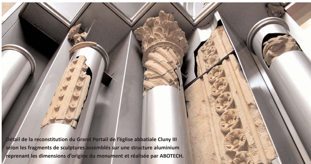
Détail de la reconstitution du Grand Portail de l'église abbatiale Cluny III selon les fragments de sculptures assemblés sur une structure aluminium reprenant les dimensions d'origine du monument et réalisée par ABOTECH.

s'impose à celles et ceux - jeune public compris - qui souhaitent découvrir le nouveau film de reconstitution 3D de la grande église Cluny III, réalisé par les ingénieurs de l'équipe Gunzo, et admirer des prêts exceptionnels comme " l'aigle de Saint-Jean ", issu des collections du Louvre. Mi-juillet, la reconstitution du grand portail sera installée de façon permanente au palais Jean de Bourbon. C'est un enrichissement monumental pour notre collection !