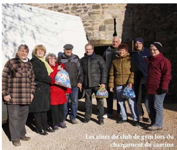
Les aînés du club de gym lors du chargement du camion

Cela fait treize ans que le club de basket handisport de Cluny organise une collecte des précieux bouchons recyclables en partenariat avec l'entreprise C2P, spécialisée dans le traitement du polypropylène. Treize ans que, grâce à vos dons, le club de basket handisport peut financer l'achat de fauteuils roulants de sport, développer et promouvoir cette pratique sportive. Merci aux particuliers, à toutes les écoles de Cluny, aux associations et au CCAS qui se sont faits le relais de la collecte 2013 soit 2,5 tonnes de petits bouchons multicolores. La Ville de Cluny soutient cette initiative par le prêt d'un véhicule de transport, la mise à disposition d'un local de stockage et la collecte en mairie de vos bouchons. Le SIRTOM de la vallée de la Grosne soutient cette action par le reversement des bouchons en polypropylène collectés en déchetterie de Cluny au Club de basket handisport.